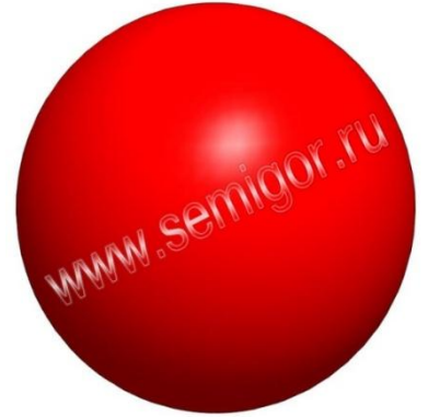
Рис. 1. Шар полиуретановый – модель

Например: шар полиуретановый Семигор ® -Ш-159 (146-85А).